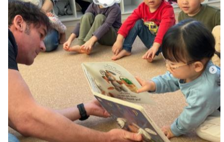
■英語教室(外国人講師)