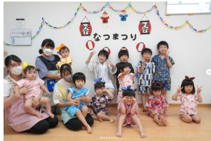
■季節に応じた年間行事