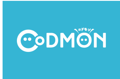
■保育ICTシステム 「コドモン」の導入