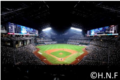
■エスコンフィールドHOKKAIDO 試合観戦(無料でご招待)