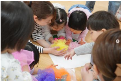
■リトミック(専門講師)