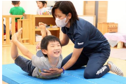
■体操教室(専門講師)