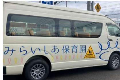
■園バス(課外授業用)